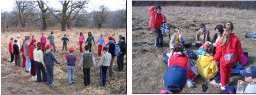
Poza 2. Joc în natura cu elevii claselor I si II (dreapta) si IV-VII (stânga)